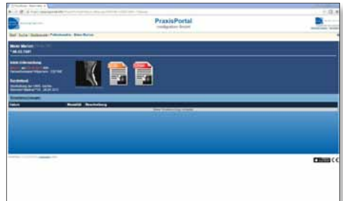
Patientenakte mit DICOM-Bildern, Structures Reports und PDF (z.B. Befunde)